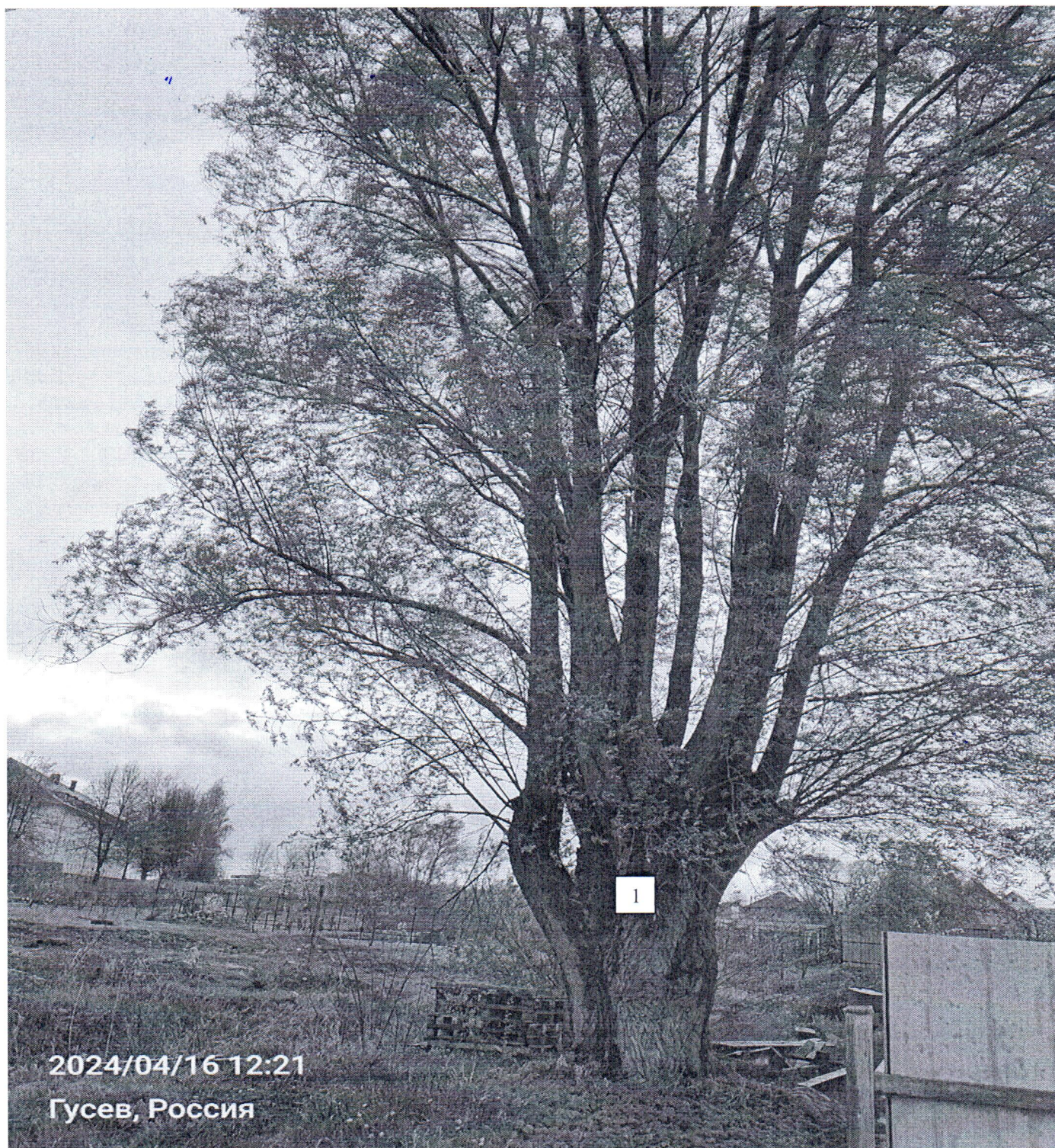
Фото-таблица (подеревная съёмка) зеленых насаждений по адресу: Калининградская обл., г. Гусев, ул. Пригородная, з/у 17

Съемку проводил ведущий специалист отдела эксплуатации и содержания объектов благоустройства