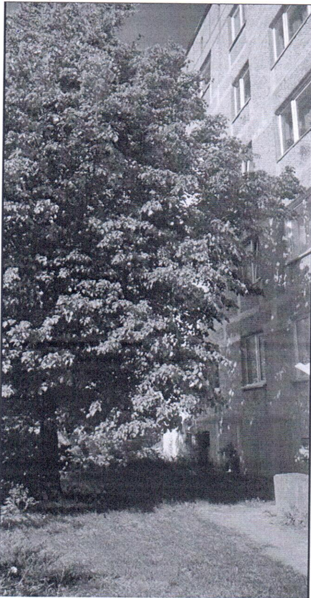
Фото-таблица (подеревная съёмка) зеленых насаждений по адресу: Калининградская обл., г. Гусев, ул. Морская, д.1Б, КН 39:04:010136:1397

Съемку проводил работник отдела эксплуатации и содержания объектов благоустройства