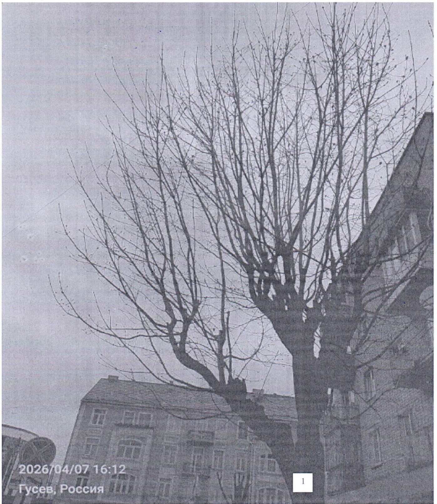
Фото-таблица (подеревная съёмка) зеленых насаждений по адресу: Калининградская обл., г. Гусев, ул. Ю. Смирнова, рядом с д. №1

Съемку проводил ведущий специалист отдела эксплуатации и содержания объектов благоустройства